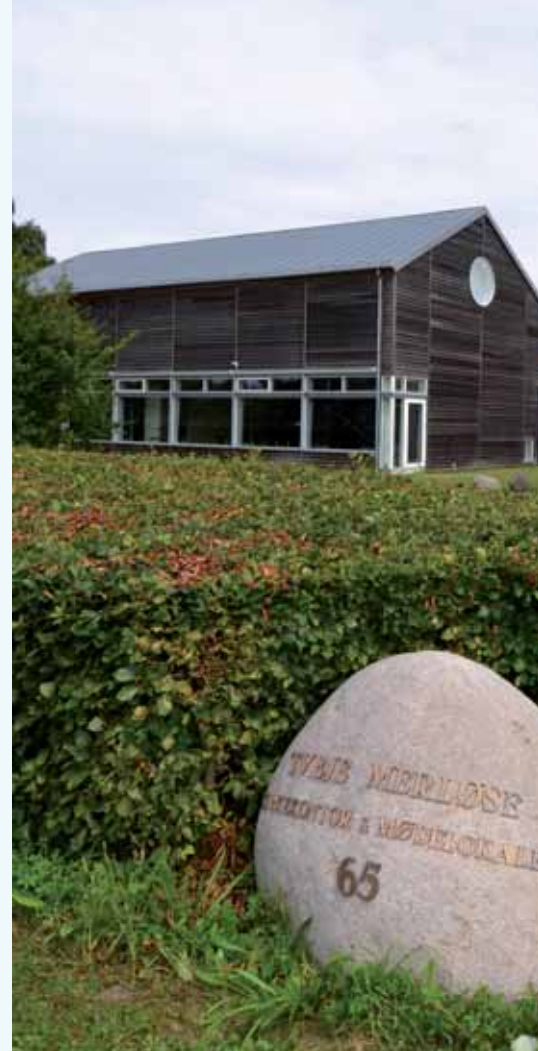
Kirkeladen, Gl. Ringstedvej 65.